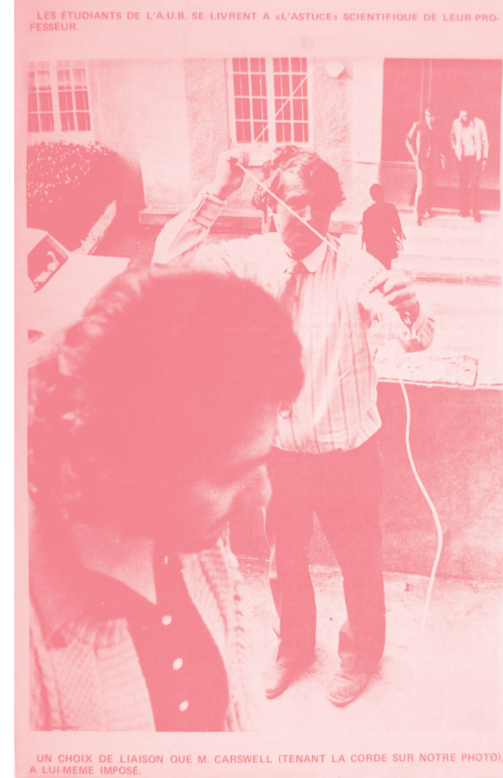
Media coverage of John Carswell's performance Tied , 1972. Carswell along with his art students wrapped with a rope the entire campus of AUB starting from the AUB president's office.

مارييت تشارلتون، برج الساعة في طرابلس، ١٩٥٣. حبر والون مائية، ٣١ X ٥٢ سم. المعارض الفنية في الجامعة الأمريكية في بيروت.