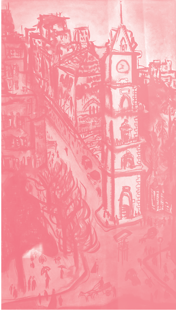
Maryette Charlton, Clock Tower of Tripoli , 1953. India ink and watercolor, 52 x 31 cm. AUB Art Galleries.

مارييت تشارلتون، برج الساعة في طرابلس، ١٩٥٣. حبر والون مائية، ٣١ X ٥٢ سم. المعارض الفنية في الجامعة الأمريكية في بيروت.